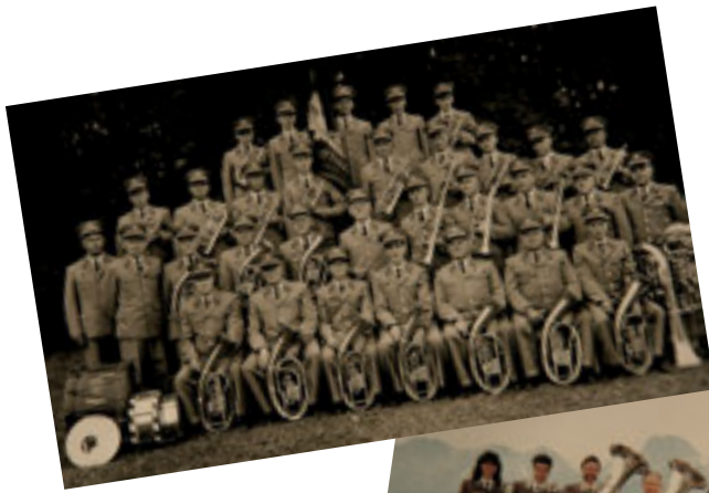
Die MG Uttigen